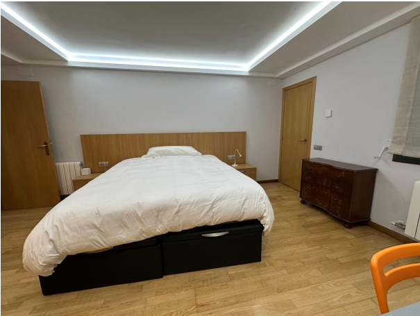
WhatsApp Image 2024-06-28 at 13.14.29 (16)