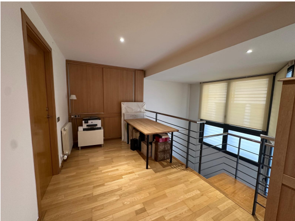
WhatsApp Image 2024-06-28 at 13.14.29 (6)