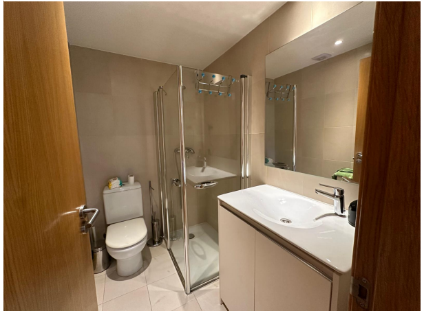
WhatsApp Image 2024-06-28 at 13.14.29 (5)