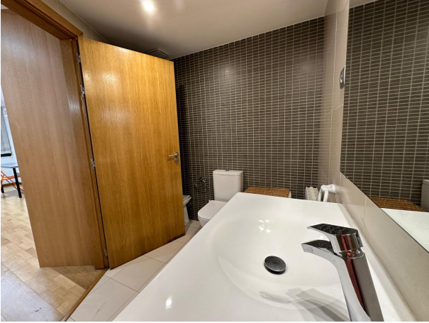
WhatsApp Image 2024-06-28 at 13.14.29 (14)