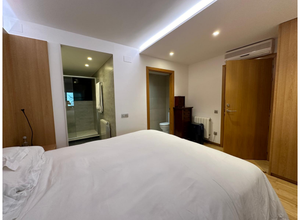
WhatsApp Image 2024-06-28 at 13.14.29 (3)