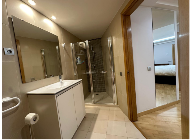
WhatsApp Image 2024-06-28 at 13.14.29 (15)