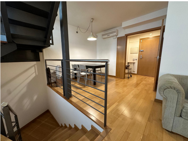
WhatsApp Image 2024-06-28 at 13.14.29 (10)