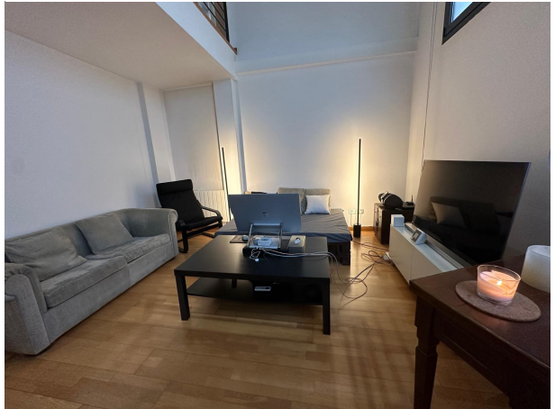
WhatsApp Image 2024-06-28 at 13.14.29 (9)