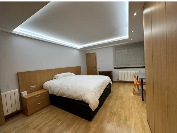
WhatsApp Image 2024-06-28 at 13.14.29 (12)