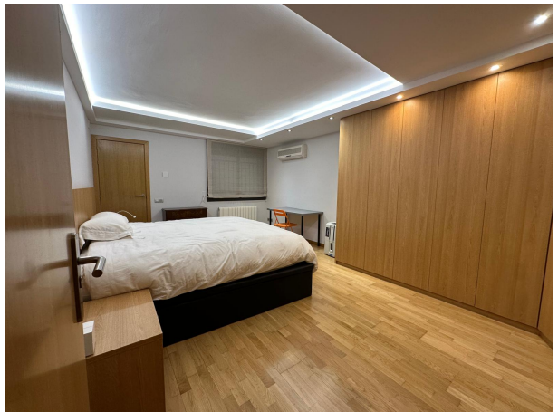
WhatsApp Image 2024-06-28 at 13.14.29 (11)