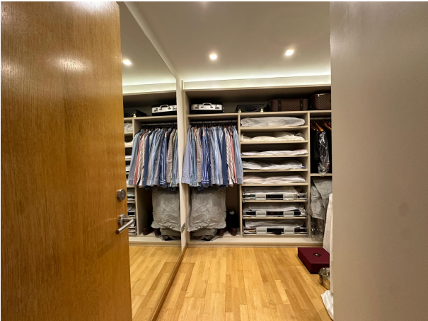
WhatsApp Image 2024-06-28 at 13.14.29 (8)