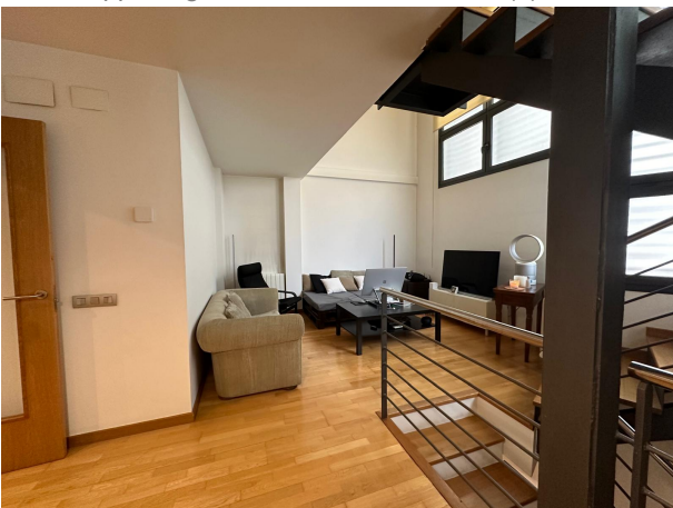
WhatsApp Image 2024-06-28 at 13.14.28 (6)