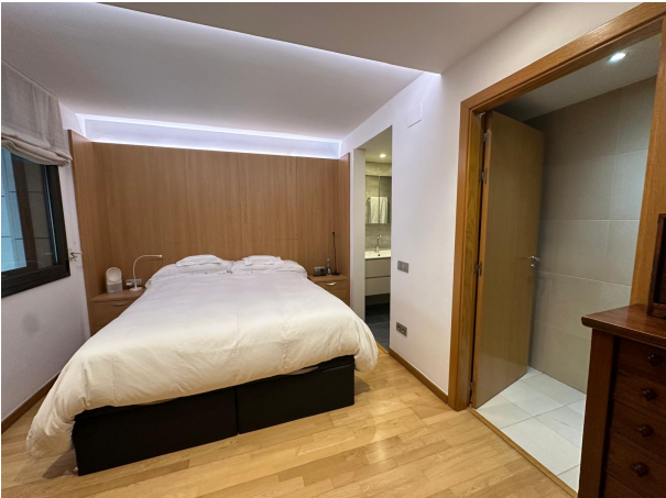
WhatsApp Image 2024-06-28 at 13.14.29 (4)