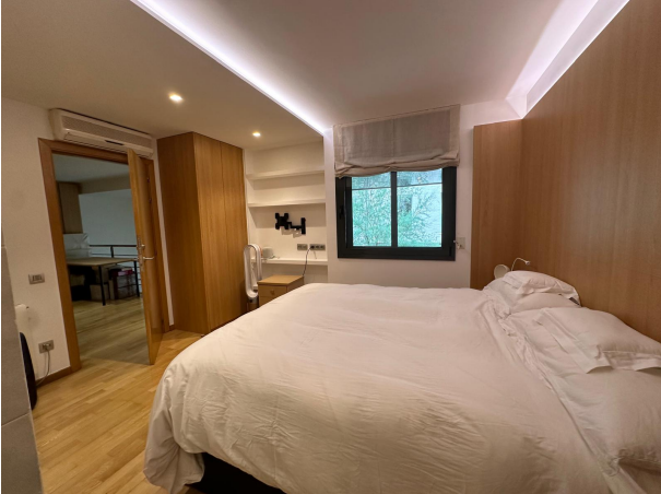
WhatsApp Image 2024-06-28 at 13.14.29 (2)